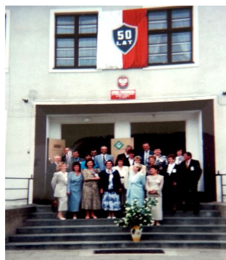
Byli i obecni nauczyciele świętujący jubileusz 50-lecia