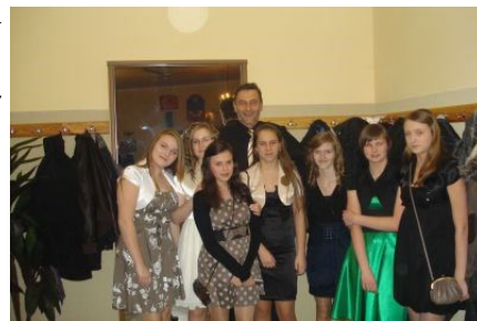
Połowinki w restauracji Tęcza