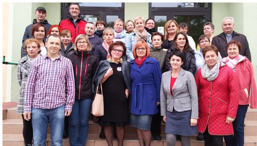
Grono pedagogiczne ZS Lipka 2015