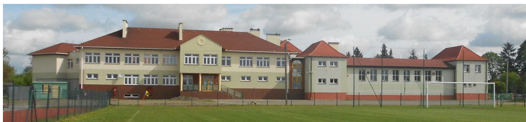
Budynek gimnazjum z salą gimnastyczną