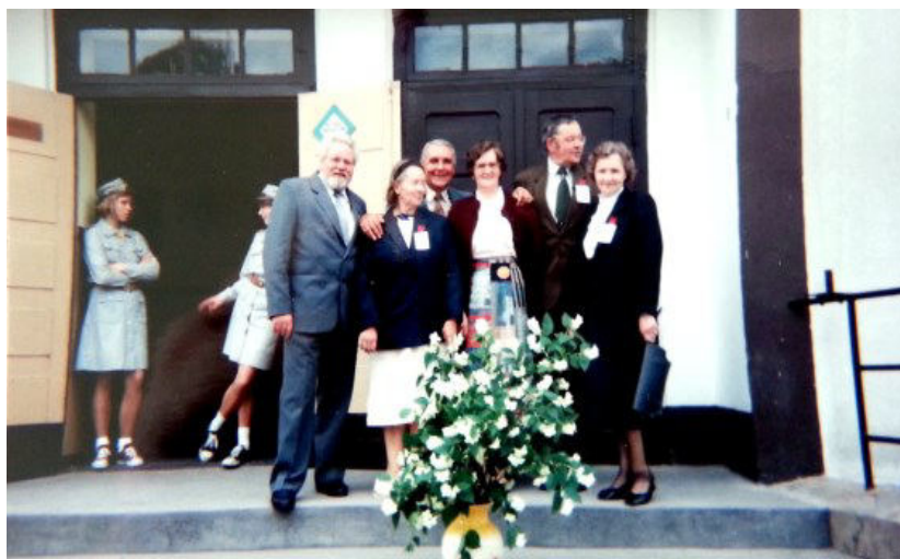
PIERWSI ABSOLWENCI OBECNI NA UROCZYSTOŚCI 50-LECIA SZKOŁY