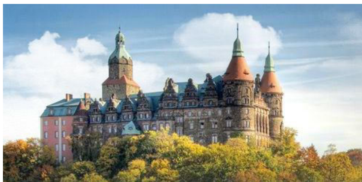
Zamek w Książu