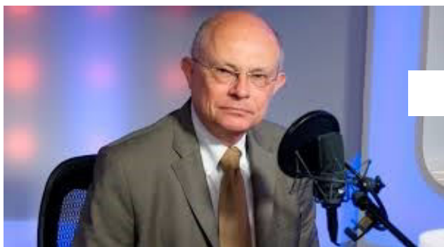
Poseł Ziemi Pilskiej Marek Borowski