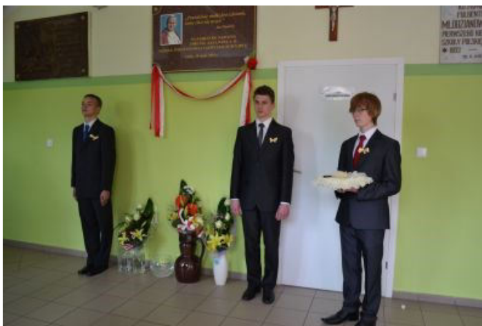
Nadanie szkole imienia Jana Pawła II