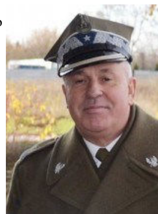
Gen. bryg. Aleksander Bortnowski