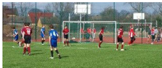
Pierwszy turniej na „Orliku”