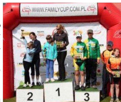
Family Cup 2010 Podium