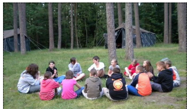
Biwak w Podgajach