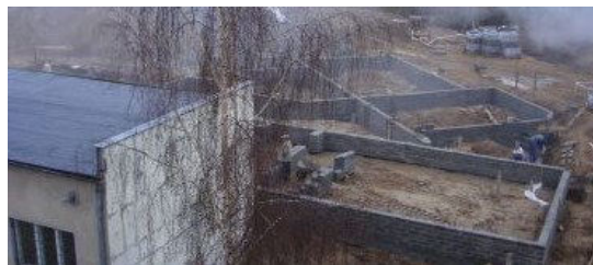
Fundamenty budynku gimnazjum