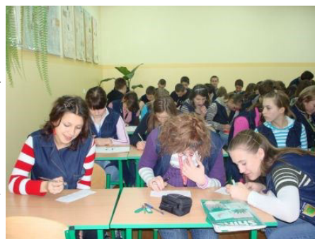
Mundurki w naszej szkole